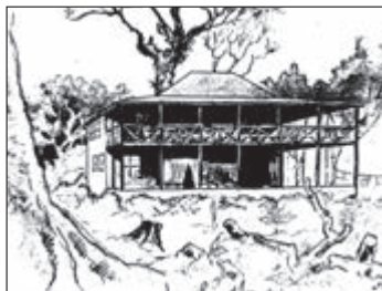
Ilustración de la primera edición de “El demonio en la botella” (1893).