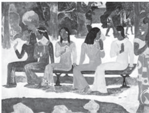
Ta matete / En el mercado, 1892.

Murió el 8 de mayo de 1903. La crítica posterior ha reconocido su talento y la importancia de su obra.