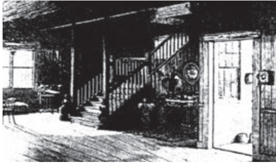
Interior de Vailima, la casa de Stevenson en Samoa.

viaje hacia América con toda su familia. Ya no regresaría a Europa. Luego de recorrer parte de los Estados Unidos, realizó un cruceo hacia las islas del Pacífico sur, de las cuales se enamoró. Compró un terreno en Samoa, en el cual construyó su casa, llamada Vailima, que significa “los cuatro ríos” en el lenguaje local.