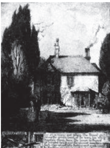
La casa de Bournemouth, Inglaterra, en donde escribió “Markheim”.

En 1887, tras la muerte de su padre, emprendió un