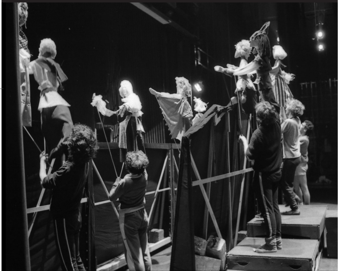
Los titiriteros manejando los muñecos entre bambalinas.